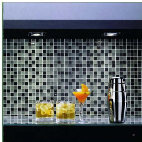
Bilde 8: Glassmosaikk i fire fargers kombinasjon.