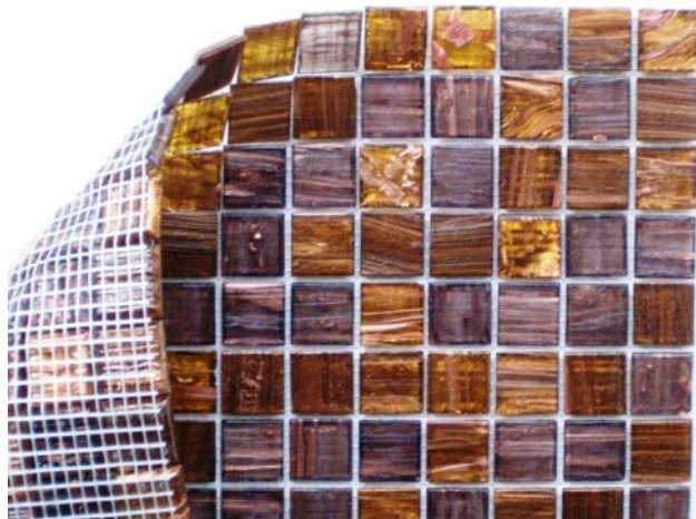
Bilde 7: Mosaikk på netting i ulike farger

I kjøkken brukes mosaikk primært på vegg. Det finnes mange farger å velge mellom.