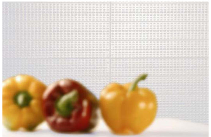
Bilde 5: Her går flis og fuger fargemessig i ett.