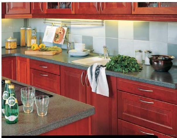
Bilde 3: Blanding av farger gir veggens variasjon. Tenk gjerne flis-størrelser som skal passe til de målene som underlaget har.

Som lim over kjøkkenbenk kan pastalim benyttes. Dette fås ferdigblandet i spann. Limet er elastisk og fester godt på alle underlag. Ellers er sementbaserte "allroundlim" lim velegnet både på golv og vegg.