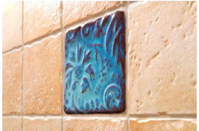
Bilde 4: Eksempel på kombinasjon dekorflis i keramikk og natursteinsfliser.