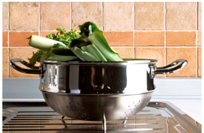
Bilde 6: Overgang vegg og kjøkkenbenk må tettes godt med fugeprofil eller elastisk fugemasse.