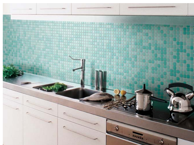
Bilde 10: Her benyttes mange farger i samspill.

I en mosaikkvegg består ca 1/5 av flaten av fugemasse. Fugemassens farge vil da påvirke fargeinntrykket. Velg gjerne kontrastfarger (farger som avviker fra mosaikkene hovedfarge), men unngå og så her helt å vite fuger.