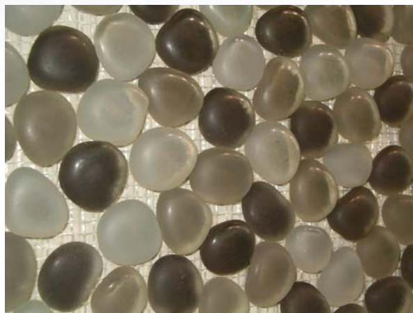
Bilde 2: Knappemosaikk

Glassmosaikk formet som knapper leveres limt på nett. De monteres i " flak" i størrelse for eksempel 300 x 300 mm. Knappemosaikk er et typisk veggprodukt og fås i ulike farger og størrelser.