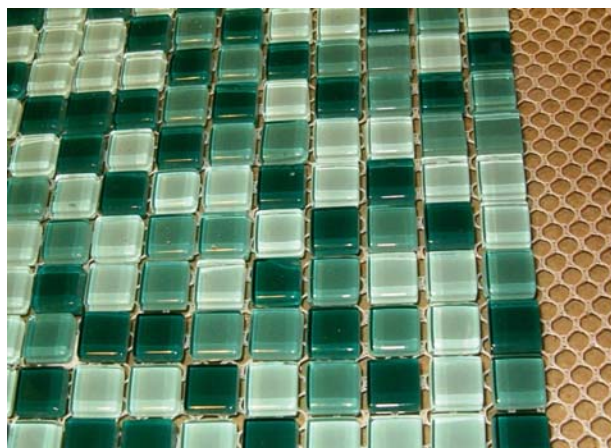
Bilde 3: Glassmosaikk

Brikkene er fra ca 10 x 10 mm og oppover. De hyppigst brukte dimensjonene er ca 20 x 20 mm. Tykkelsen er 2 -3 mm.