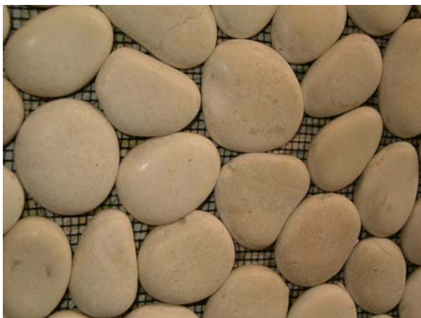
Bilde 1: Strandstein

Strandstein/ elvestein er naturlig rullestein i ulike formater som er limt fast på netting. Bruksområdet er dusjniser og lignende. De runde steinene hevdes å kunne gi en behagelig masserende effekt når man står på dem. Prøv selv!