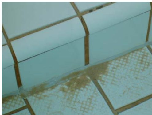
Bilde 3: Vann og kjemikalier i svømmebassenger kan tære borte sementbaserte fuger på kort tid.

Det er noen kjemikalier som i konsentrert form eller lang eksponeringstid, kombinert med høy temperatur tærer på fugene. Sement er ømfintlig for sure kjemiske stoffer dvs. \text{pH} \leq 7 . Men de tåler godt alkaliske væsker. Det kan likevel være noen organiske tilsetningsstoffer i sementbaserte fuger som er ikke tåler sterke alkalier. Norsk drikkevann er generelt bløtt og noe surt og er aggressivt på fuger av sement. .