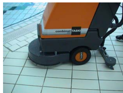
Bilde 2: En sort roterende pad på rengjøringsmaskiner kan slipe bort fugemasser. Ved maskinell rengjøring skal det brukes myke padbørster, for eksempel røde eller grå.

Under de fleste forhold er den mekanisk slitastyrke god nok også på de sementbaserte massene. Men på gulvflater med høy mekanisk påkjenning, f.eks. maskinrengjøring med roterende pad eller høytrykkspyling vil epoksyfugen ha lengst levetid.