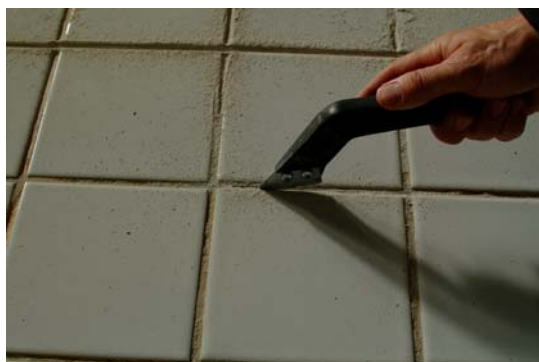
Bilde 6: Å skrape bort fugerester samt å refuge er en møysommelig og kostnadskrevende prosess.

Det tenkes ofte for kortsiktig ved materialvalg og det velges billigste alternativ. Etter forholdsvis kort tid må omfuging gjøres hvis produktet er i et miljø hvor det ikke tåler påkjenningene. Dette er ikke lønnsomt. i et totaløkonomiperspektiv. Det kan lønne seg å betale litt ekstra for så å ha en flate som er bortimot vedlikeholdsfri og renholdsvennlig i mange år.