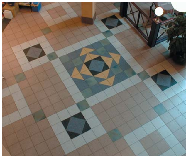
Porcellanato – lavt vannopptak og god målenøyaktighet. Fra Vinterbro senter. Ark.: Aakerøy, Moe & Bow