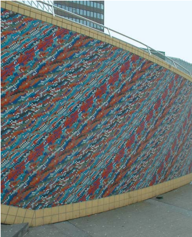
Glassmosaikk – til kledning og utsmykning av overflater både inn- og utvendig. Fra Sonja Henies plass, Oslo.