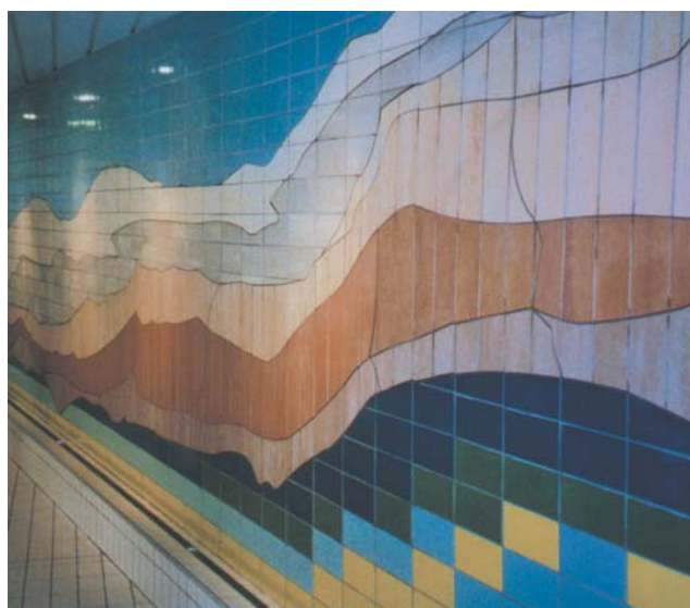
Monocottura – slitesterk overflate, lett å holde ren. Bildet viser en kombinasjon av monocottura og porcellanato. Vegg i svømmehall. Interiørarkitekt Greta Hoff Skjeseth